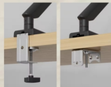
MONTAJE CON ABRAZADERA EN C